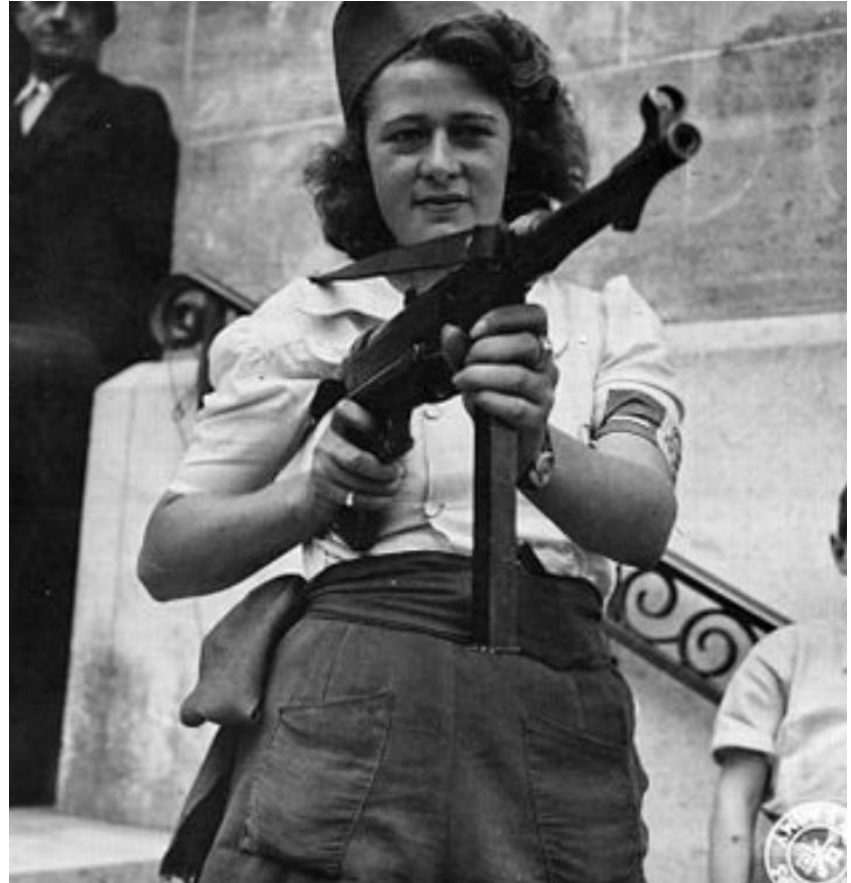
Simone Segouin (1925- )