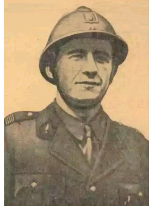
Pierre Georges alias “Colonel Fabien” (1919-1944)