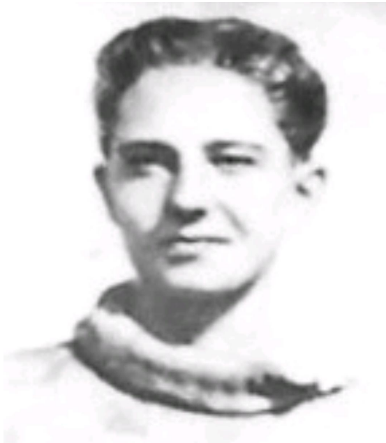
Guy Moquet (1924-1941)