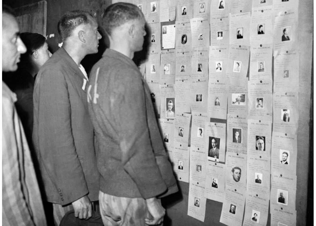
Déportés de retour en France à l'hôtel Lutetia, Mai 1945