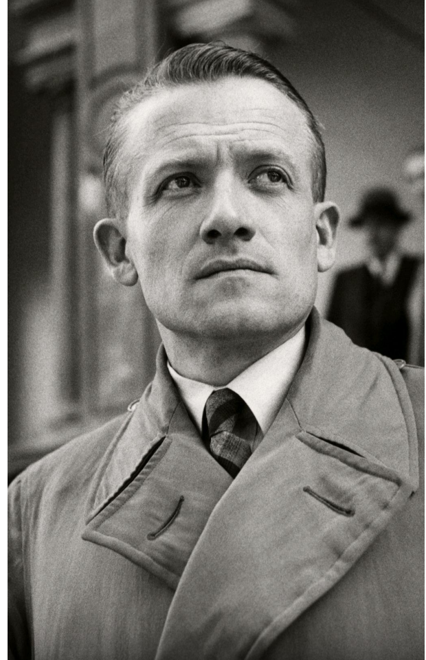
Henri Frenay (1905-1988)