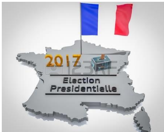
Image 1. Élection présidentielle 2017