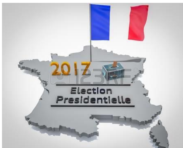
Élection présidentielle 2017